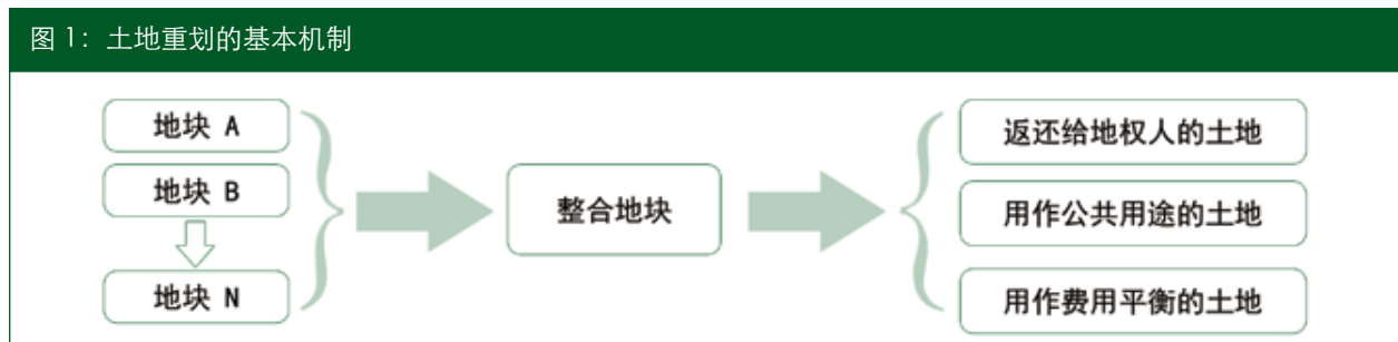
图 1：土地重划的基本机制

土地重划通过将选定地区零散杂乱的地块交换整合为平整规则的地块，并完善地区基础设施，将剩余部分地块按照一定比例返还给地权人，来达到城市开发或再开发的目的。