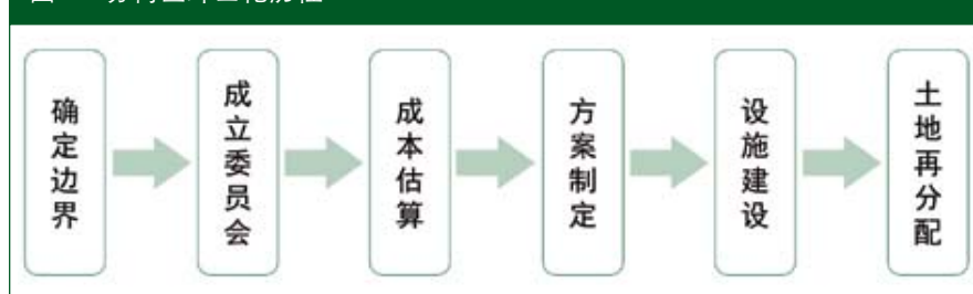
图 3：苏荷区绅士化历程

如果文化艺术是苏荷区第一阶段绅士化的驱动力，那么产业的升级转型则是苏荷区第二阶段绅士化的根本原因。苏荷区声名鹊起后首先推动了旅游业的兴旺，20 世纪 70 年代中期，苏荷区已经成为纽约最具人气的几个旅游热点之一。苏荷区旅游业的兴旺繁荣了本地区的画廊产业、零售业和餐饮服务业，土地价值不断上升，推动了以律师、医生、银行家等为代表的中产阶级前来定居，开启了经济因素主导下的以中产阶层为行为主体的第二阶段的绅士化进程。